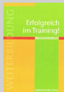
Erfolgreich im Training! Praxishandbuch BOD Verlag 2009